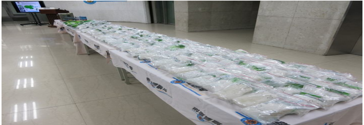
跨國運毒案，起出 92 公斤餘的安非他命。記者陳金松／攝影