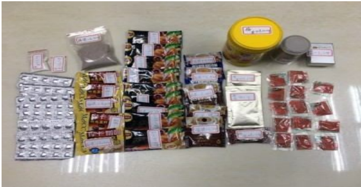
元姓毒販搭賓士改裝車販毒，未料因改裝車太醒目被逮，被查扣 1.3 公 斤毒咖啡包及毒奶茶半成品。(記者吳仁捷翻攝)